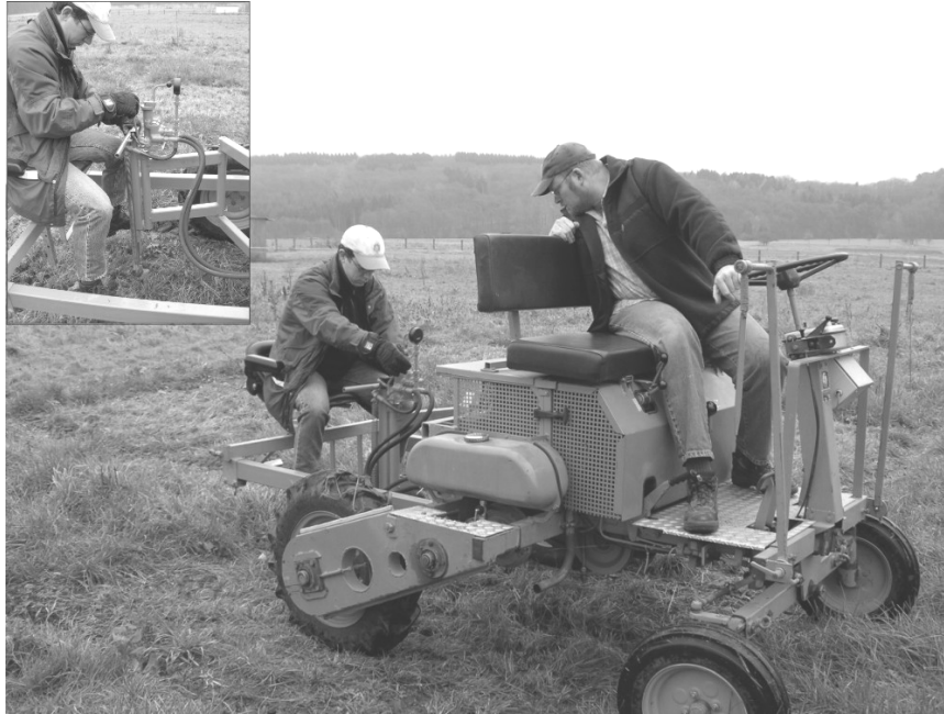
Abb. 1: Versuchsgesetztrager „Hege 75“ mit angebauter hydraulischer Rinderklaue.