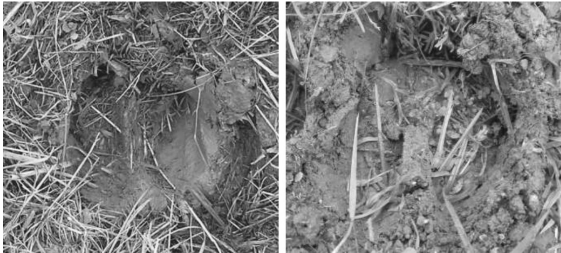
Abb. 3: Abdruck einer echten (links) und der mechanischen Klaue (rechts) in feuchtem Boden.

Auch augenscheinlich betrachtet, erscheint der Abdruck der mechanischen Klaue gegenüber dem der Klaue eines lebenden Rindes realistisch (Abb. 3).